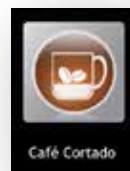
Conjunto de etiquetas 2