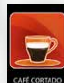
Conjunto de etiquetas 4