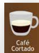
Conjunto de etiquetas 3