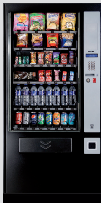
Palma + Hz70