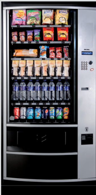
Palma + H70